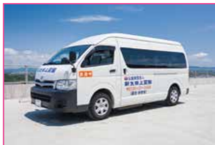
へ送迎バス写真へ

星ヶ峯・皇徳寺・桜ヶ丘・明和など大幅路線拡大で大変便利になりましたので是非ご利用下さい。又事務所等で写真入りの送迎バス案内図も配布しておりますので、ご自由にお持ち帰り下さい。 ※全ての路線で時刻が改正されています。お間違えのないようにご注意ください。