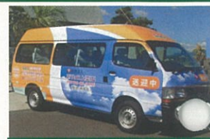
霊園・太陽ヘルス送迎バス