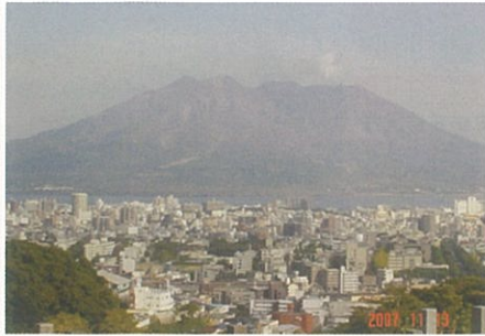
軽専用駐車場から撮影しております。 晴れた日は吉田町の風車まで見えます。

新生 田上霊園のホームページをご覧ください。12月にリニューアルして皆様から募集しました、俳句・詩などをどんどん掲載していきます！ http://www.fagamireien.or.jp