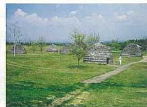
▲復元された住居集落群