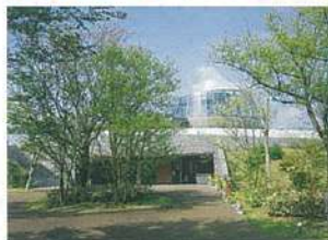
▲上野原縄文の森 展示館