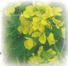
今、菜の花が満開で見ごろです！