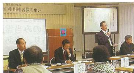
▲ 当日は、理事長・副理事長・理事・総務部長から説明致しました。

11月17日(土)に第3回使用権者様の集いが行われました。当日は雨の降るあいにくの天気となりましたが、45名の使用権者様が来会され、平成24年の当園の事業内容と今後の事業計画をご説明致しました。当日来会された方々から、貴重なご意見やご要望を伺うことができました。今後の運営の参考にさせていただきます。ご参加いただき、ありがとうございました。