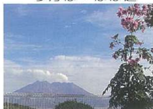
▲霊園中庭の皇帝ダリアと桜島

皇帝といふダリアをなす ダリアは夏七月の季節ですが、皇帝ダリアは冬に咲きます。俳句は五七五の十七音(字)の文学ですが、この句は十五音です。この両方を工夫して、次のようにしてみました。