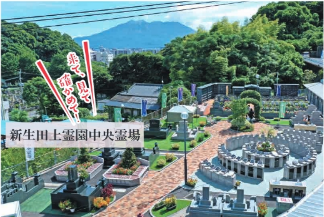
新生田上霊園中央霊場

見学特典 20周年記念 オリジナルデザイン エコバッグ プレゼント♪ ※初回のみアンケート記入の方 ※一組におひとつ